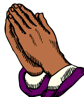
CLAP YOUR HAND