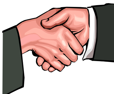
SHAKE YOUR HAND