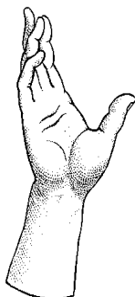
RAISE YOUR HAND